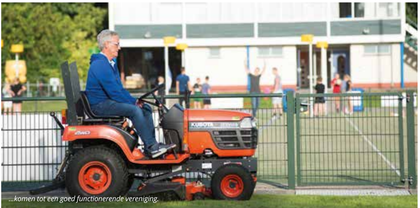
...komen tot een goed functionerende vereniging.

“We hebben in september al een bosdag gehouden met het nieuwe bestuur om samen na te denken over die vraag. Een van belangrijke taken is het organiseren van sociale activiteiten en netwerkborrels. Omdat ledenbinding een taak is die ook tijdelijk (gedeeltelijk)